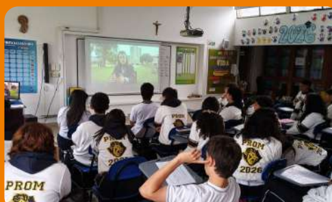
Charla programa de inmersión Colegio del Santo Ángel