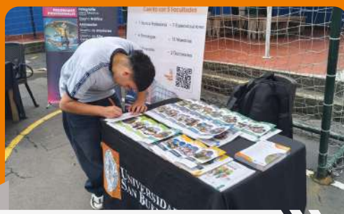
Feria universitaria Colegio Monte Helena

Entre enero y febrero, la Universidad de San Buenaventura llevó a cabo actividades de acercamiento dirigidas a estudiantes de colegio, fortaleciendo el vínculo entre la institución y los jóvenes interesados en explorar su futuro universitario.