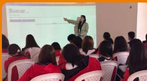
Capacitación por parte de editorial a estudiantes del colegio Bethlemitas Norte sobre búsqueda bases de datos