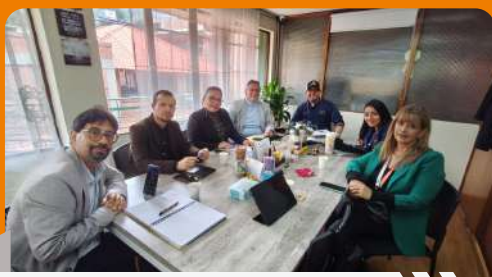
Reunión de cooperación y alianzas con decanos y directivas del colegio colombo sueco