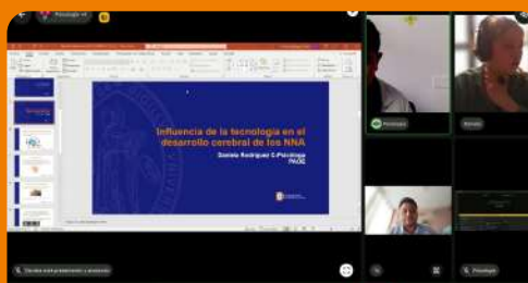
Charla para padres influencia de la tecnología en el desarrollo cerebral de los niños y niñas Colegio del Santo Ángel