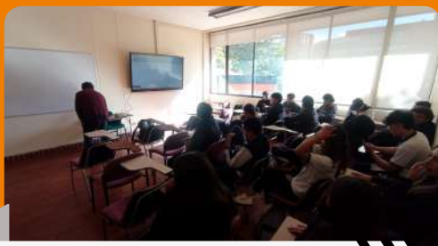
Visita al campus – Colegio del Virrey Solís