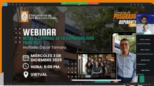
Webinar: retos y caminos de la espiritualidad para hoy

En noviembre, la Universidad de San Buenaventura recorrió varios colegios de Bogotá y la región, compartiendo su oferta académica y sembrando inspiración en futuros universitarios.