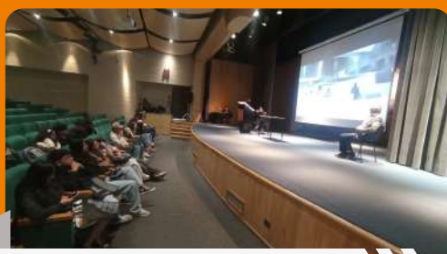
Visita al campus – Colegio Nuevo San Luis Gonzaga