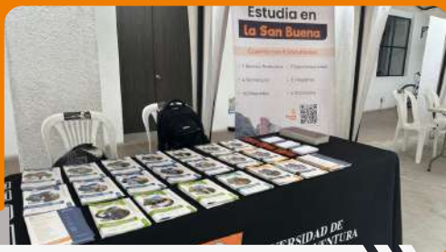
Feria Funza Evolucionando Transformando Futuro