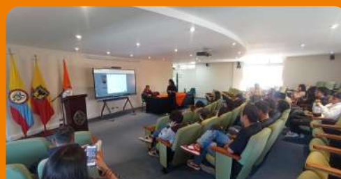
Visita al campus – Alcaldía de Usaquén