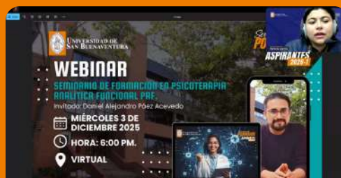
Webinar: seminario de formación en psicoterapia analítica funcional (PAF)