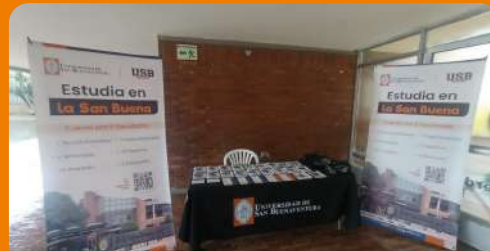
Stand – Eucaristía de Fin de Año, Colegio del Virrey Solís