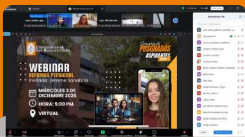
Webinar: reforma pensional