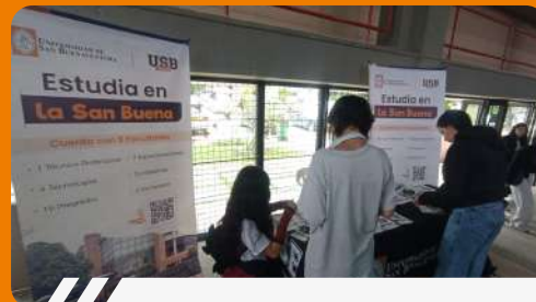
Stand Exposanbuena 2026