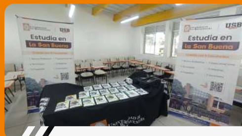
Feria Universitaria – Colegio Francisco de Paula Santander