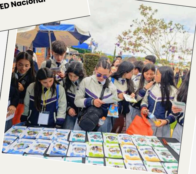
Congreso de Filosofía Colegio Bilingüe San Juan de Ávila