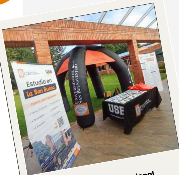
Feria CONACED Nacional