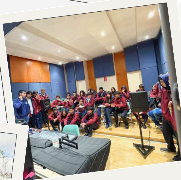
Visita al campus Liceo Normandía