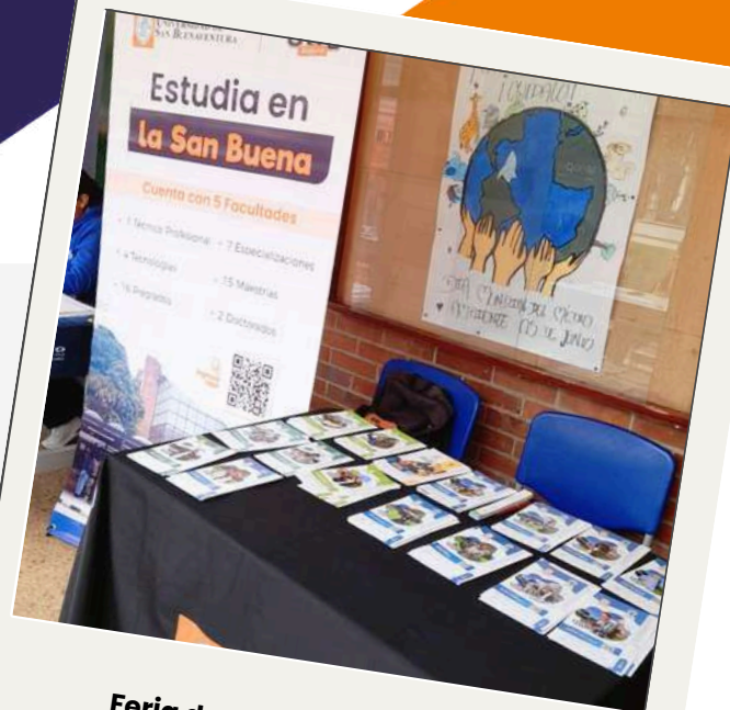
Feria de la Alcaldía de Usaquén Colegio Cristóbal Colón

En el mes de julio, la USB recorrió varios colegios de Bogotá y la región, compartiendo su oferta académica y sembrando inspiración en futuros universitarios.